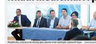
Akademski sastanak do idućeg ljeta planira imati stotinjak nastavnih baza

Specijalna bolnica "Sv. Katarina" u Zagrebu postaje nastavna baza Sveučilišta u Splitu, a mladi medicinari i profesori liječit će sporta.