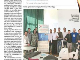
Državni tim kinezioloških studija u Splitu

O splitski kineziološki projekt izišao u svijet, a njegov najvažniji rezultat svakako će biti njegovo upravljanje Instituta za kineziologiju.